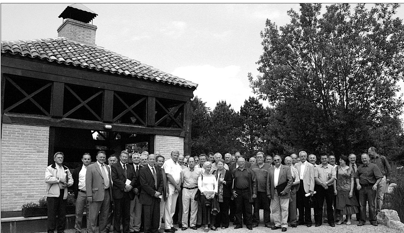
Les élus du SESDRA ont planché le 5 juin dernier sur le schéma de cohérence territoriale. Il devra être approuvé avant décembre 2010.

Schéma de cohérence territoriale : le calendrier